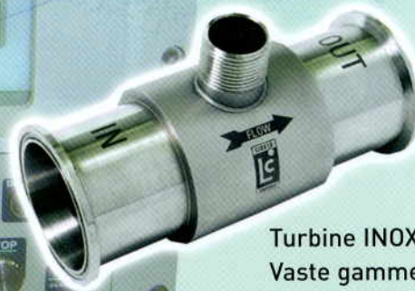
Turbine INOX Vaste gamme de mesures Dosage précis Haute Précision ATEX